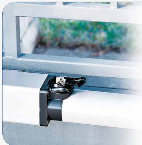
Release cover Clapet du déblocage Apertura desbloqueo de la puerta