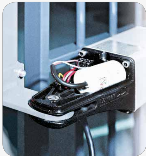
Rear fixing Raccord postérieur Enganche posterior